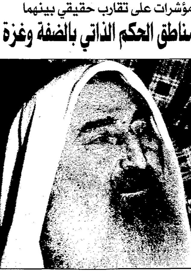
الشيخ أحمد ياسين

القاهرة - رويترز: قال وزير الخارجية المصري عمرو موسى أمس الثلاثاء إن لحظة الحقيقة قريباً فيما يتعلق بعملية صنع السلام في الشرق الأوسط. وقال موسى في خطاب له في القاهرة في 12 كانون الثاني/يناير 1998: «أنا كاتب فرنسي مسلم يدين إسرائيل في كتابه الذي يفضح جرائمها». وقال موسى في خطاب له في القاهرة في 12 كانون الثاني/يناير 1998: «أنا كاتب فرنسي مسلم يدين إسرائيل في كتابه الذي يفضح جرائمها».